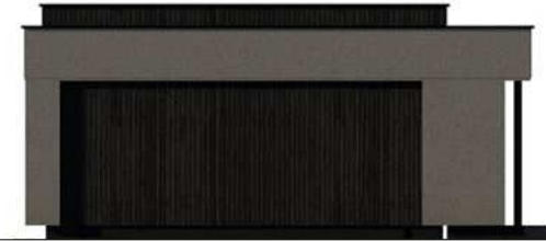
ELEWACJA BOK 1