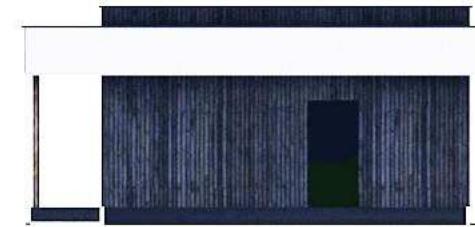
ELEWACJA BOK 2